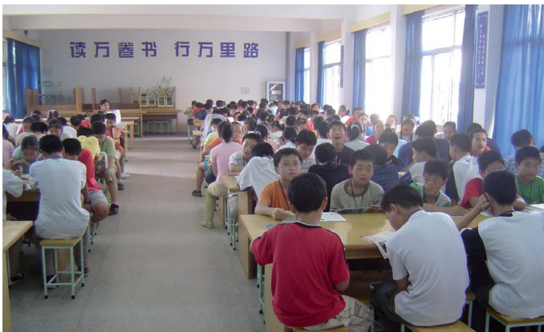
Lesestunde chinesischer Schüler in der Bibliothek.