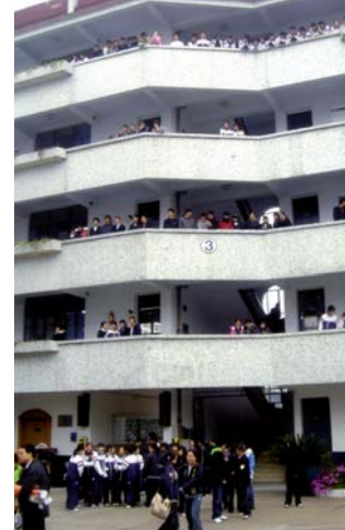
Das Gebäude der Partnerschule in China – fotografiert vom Innenhof der Schule aus.