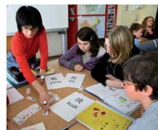
Chinesischunterricht findet an der GSG bereits ab Klasse 6 statt.