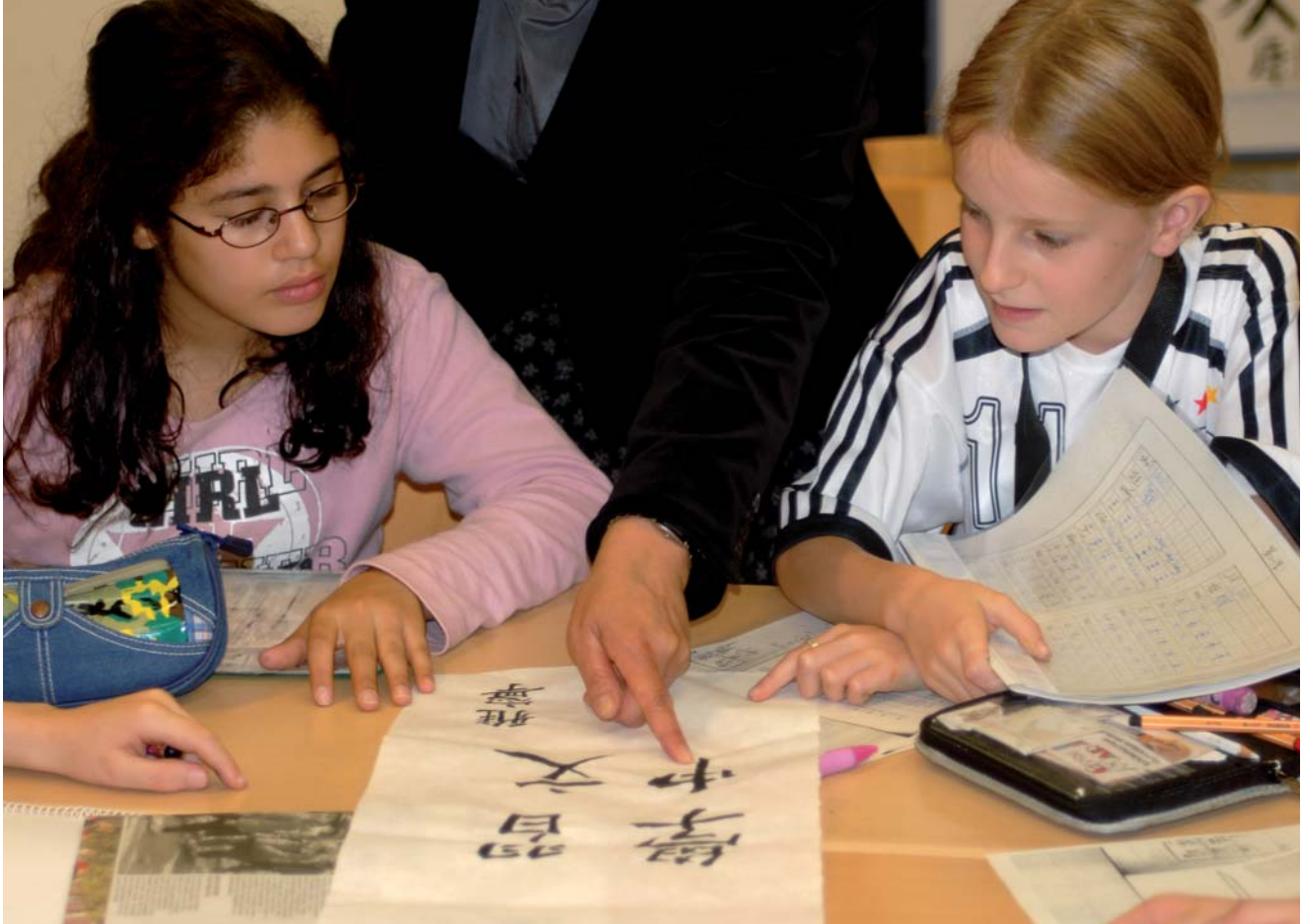
Von Beginn an geht es auch im fremdsprachlichen Unterricht um den Schriftspracherwerb.

Wandsbek besonders viele chinesische Familien niedergelassen haben. So wurde schließlich am 20. September 2002 im Rathaus das Memorandum zur Einrichtung des bilingualen Zweiges zwischen Hamburg und der Volksrepublik China unterzeichnet. Es legt fest, dass ein Chinesischlehrer oder eine Chinesischlehrerin, geschickt und bezahlt von der Volksrepublik China, Unterricht an einer staatlichen Schule in Hamburg erteilt. Bereits im folgenden Schuljahr, im Sommer 2003, wurden die ersten chinesischen Schülerinnen und Schüler im Jahrgang 5 eingeschult und wenig später konnte Dr. Jiehong Zhang, unsere neue Chinesischlehrerin, den Unterricht aufnehmen.