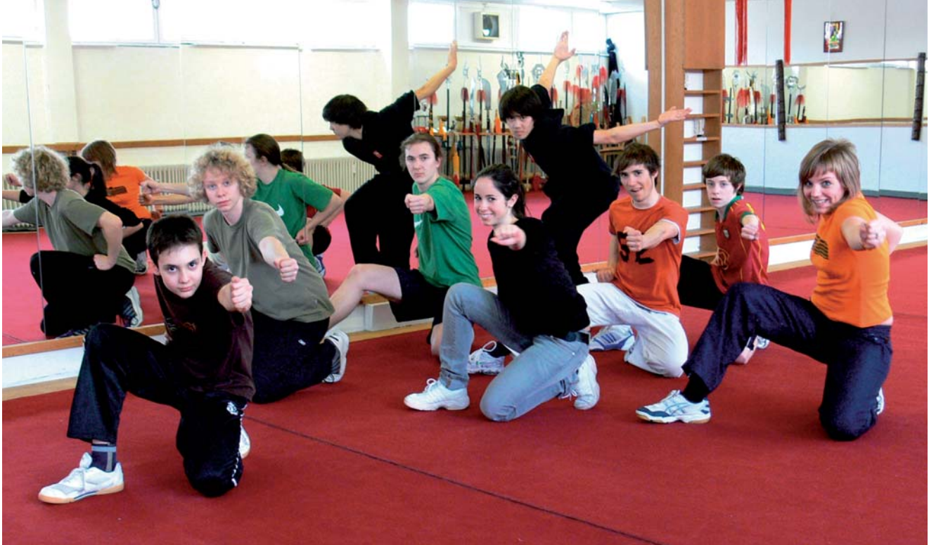
Im Wushuzentrum in Konstanz üben die Schüler den chinesischen Kampfsport ein. Auf dem Bild „machen sie den Adler“, wie die Übung heißt.

herstellt, und Großunternehmen wie MTU (Motoren und Turbinen Union) und ZF (Zahnradfabrik in Friedrichshafen). Diese Firmen produzieren am Standort Friedrichshafen für den chinesischen Markt und haben Produktionsstätten in China aufgebaut. Mit einem Fragenkatalog bereiteten sich die Schüler vor und erhielten aufschlussreiche Antworten.