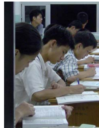
Konzentrierte Arbeit chinesischer Schüler bis spät in die Abendstunden.

Einblicke in den Industriestandort Deutschland soll zum Beispiel die Besichtigung des BMW-Werks in Dingolfing geben.