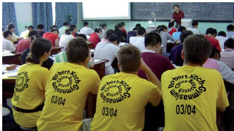
Dem chinesischen Physikunterricht können auch deutsche Schüler bestens folgen.