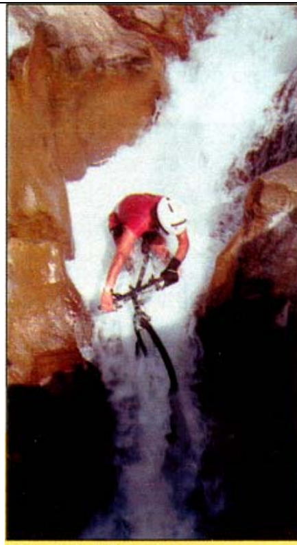
2. Mountain bike downhill