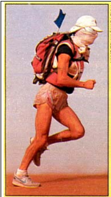
1. Maratona estrema