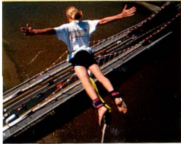
5. Bungee jumping