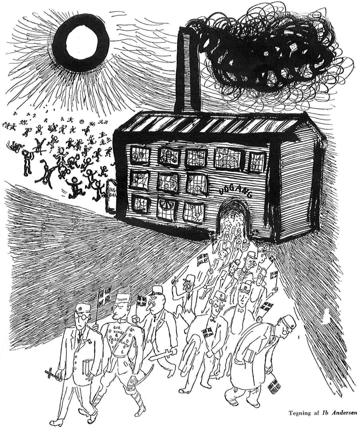
Tegning af Ib Andersen.