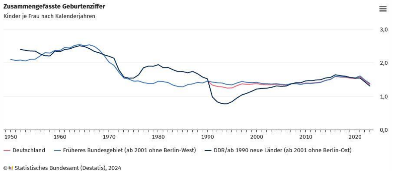
Grafik 3.1 Zusammengefasste Geburtenziffern 1950 bis 2023 (Kinder je Frau)

Für weitere Informationen sind die Veröffentlichungen des Statistischen Bundesamtes zu bemühen, siehe: URL.: https://www.destatis.de/DE/Themen/Gesellschaft-Umwelt/Bevoelkerung/Bevoelkerungsvorausberechnung/inhalt.html#sprg233474 .